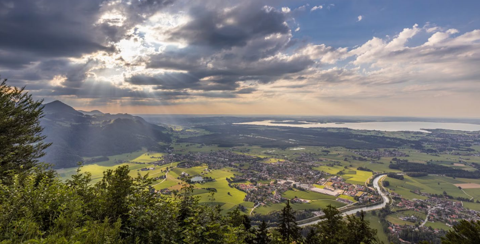
Abbildung 2: Blick auf Markt Grassau