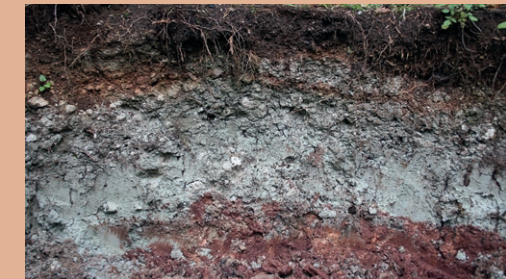
Farbenprächtige Böden sind zu entdecken.

Lernen Sie verschiedene Bodentypen kennen; hier z. B. einen Pararendzina.