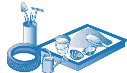
Asiatische Tigermücken legen ihre Eier in kleinen Wasseransammlungen ab.

Gechlorte Pools, Badeseen oder Flüsse sind ebenfalls keine geeigneten Brutstätten.